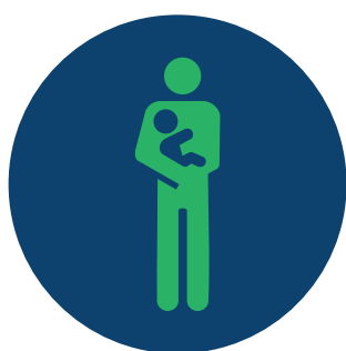
Pessoas com crianças de colo

Em atendimento ao Decreto-Lei n.º 58/2016, de 29 de agosto, a AADESAM concede atendimento prioritário aos seguinte grupos: