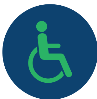
Pessoa com deficiência