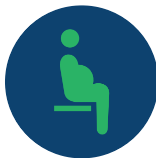
Grávidas / lactantes