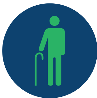
Idosos a partir de 60 anos